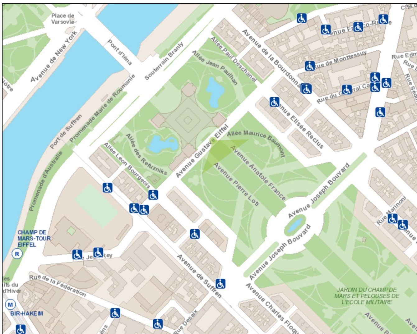
Ci-dessus : plan indicatif des places adaptées les plus proches