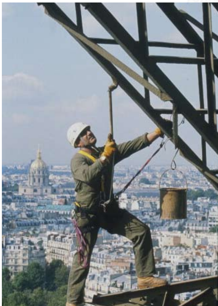
Peintres en train de repeindre la Tour à l'aide d'une brosse (pinceau à long manche)

pour la recouvrir de sa nouvelle toilette. Pour la sécurité des ouvriers, 50 km de cordes de sécurité et 2 hectares de filets de protection sont installés.