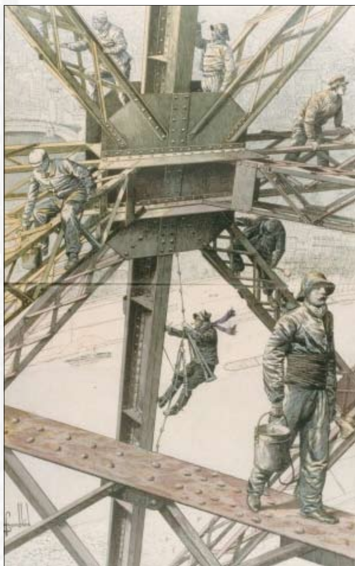
La peinture de la Tour Eiffel - À 230 mètres de hauteur