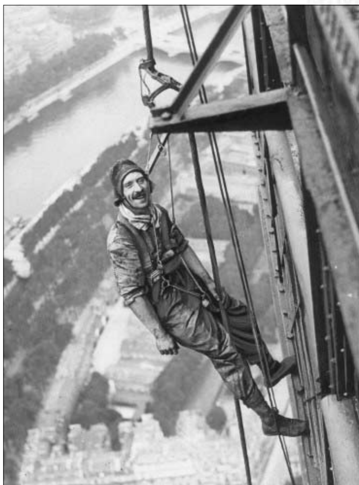
Un peintre de la Tour suspendu à un câble

prix de cette dernière couche s'est élevé à 60 000 francs or. En 1892, un nouvel entrepreneur fut choisi pour la première campagne d'entretien de la Tour, M. Rivière. On lessiva le revêtement d'origine, puis on appliqua une couche de peinture à l'huile, pigmentée à l'ocre jaune, garantie cinq ans et qui coûta 57 000 francs or.